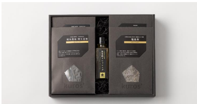
厳選昆布ギフトセット 4,644円

出汁取りから最後の仕上げの調味料まで、昆布の旨味をまるごと味わうギフトセットが新たに登場します。国産原料にこだわり、素材本来の味を最大限に引き出しました。黒一色のパッケージで、スタイリッシュな贈り物としても。昆布の持つ栄養・おいしさを毎日摂りたくなるセットです。