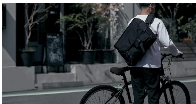
軽量コーデュラナイロン メッセンジャーバッグ 24,200円

日本最大の鞆の産地である兵庫県豊岡市のメーカーと開発したオリジナルバッグです。荷物を取り出すときの開閉時や、体に密着した際のフォルムなど、日々の何気ない動作のなかで感じる快適性と美しさから、豊岡市の財産である技術力の高さを感じていただけます。そんな縫製技術の高さを最大限に引き出す素材の追求とともに、自信を持って長く愛用していただける新商品が生まれました。