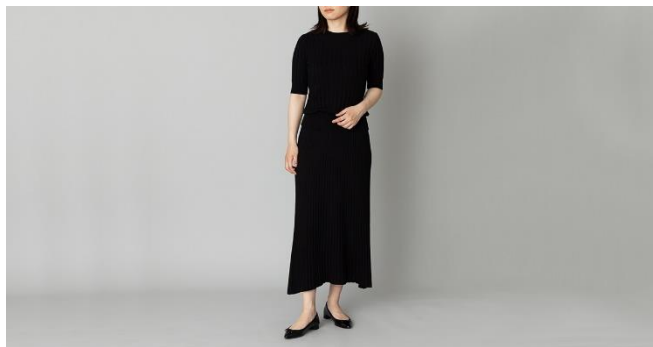
シルクカシミア リブ半袖ニット 24,200円 シルクカシミア リブニットスカート 30,800円

糸から編み立てまで、一貫して国産にこだわったニットが登場します。ニットにとって素材の次に大切なのが水と言われており、洗いは素材の良さを引き出す重要な工程です。同商品は国内でも珍しい地下130mから汲み上げる超軟水の井戸水を使用することで、滑らかで温かみのある唯一無二の風合いを実現しています。この「洗い」は、復興支援の為に拠点を移動した福島県にて行われていることも特徴です。