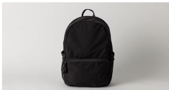
スエード調リュック 21,780円