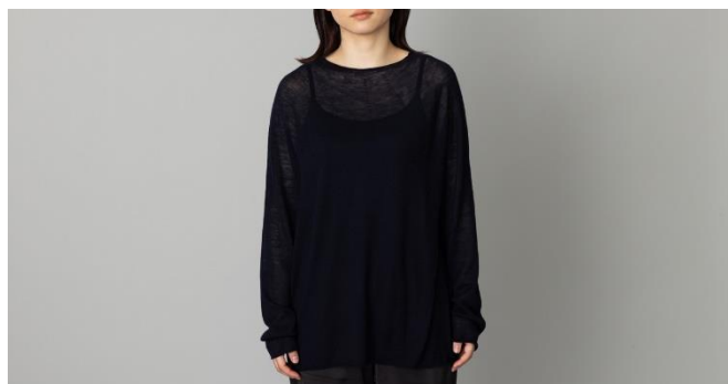
カシミアニット シアートップス 24,200円