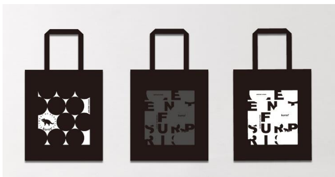
kuros'オリジナルキャラクター コットントートバッグ 2,530円