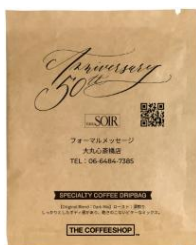
ご来店記念ノベルティ