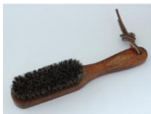
オープン記念ノベルティ