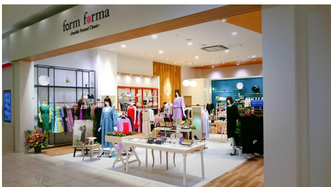
テラスモール湘南店