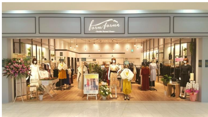
阪急西宮ガーデンズ店

フォーマルを身近に感じていただけるよう開発した新業態。様々なシーンを彩る新しい感覚のショップ。2010年9月に越谷レイクタウンに初出店し、既存店(本出店含む)は関東エリアに13店舗、関西エリアに7店舗、中国エリアに2店舗、東海エリアに2店舗、WEB 4店舗(ゾゾタウン・マガシーク・ストライプデパートメント・formformaオンラインストア)の計28店舗。