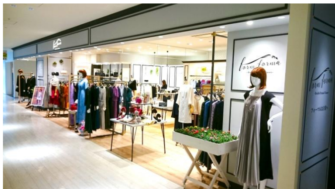
グランフロント大阪店